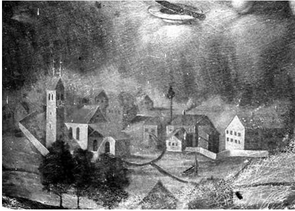
Bizau und der Schwanen