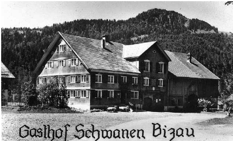
Postkarte vom Schwanen (1958)